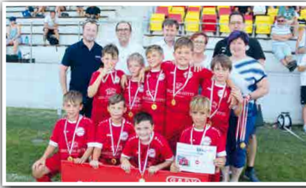
Bild: Town & Country Haus: Oberpullendorfs U9 hatte bei den Spielen auf der eigenen Anlage jede Menge Spaß.

Die SCO Juniors luden am vergangenen Wochenende zum traditionellen Sommerturnier. 57 Teams folgten der Einladung und verwandelten so das Fenyös-Stadion in ein Tollhaus. Die Titel in den drei Altersklassen gingen in die Bundeshauptstadt.