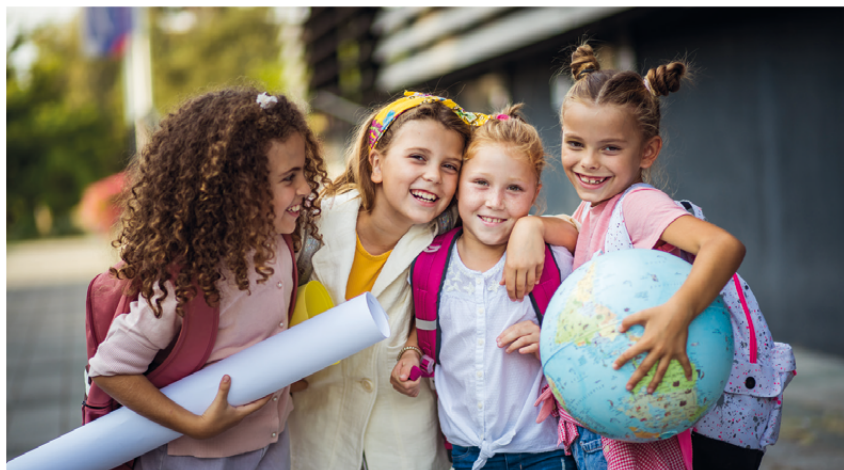
Unterstützen Sie die Gesundheit Ihrer Kinder. Für einen starken Start ins neue Schuljahr!

Die Gesundheit der Kinder sollte jetzt im Fokus stehen. Eine gute Mikronährstoffversorgung kann entscheidend dazu beitragen, dass die Kinder einen optimalen Start in die neue Schuljahreszeit und in den Herbst haben.